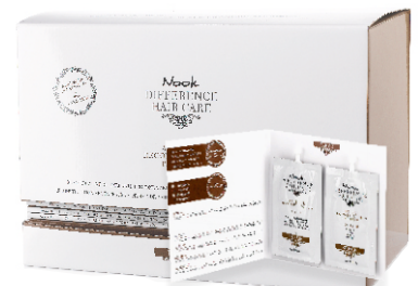
REPAIR ANTI-AGE RECONSTRUCTION PROGRAM (12 ml + 12 ml: single-serve application) Box 50 card - cod. 1027604