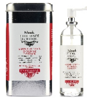
ENERGIZING SUPER ACTIVE INTENSE LOTION 100 ml - cod. 1000617