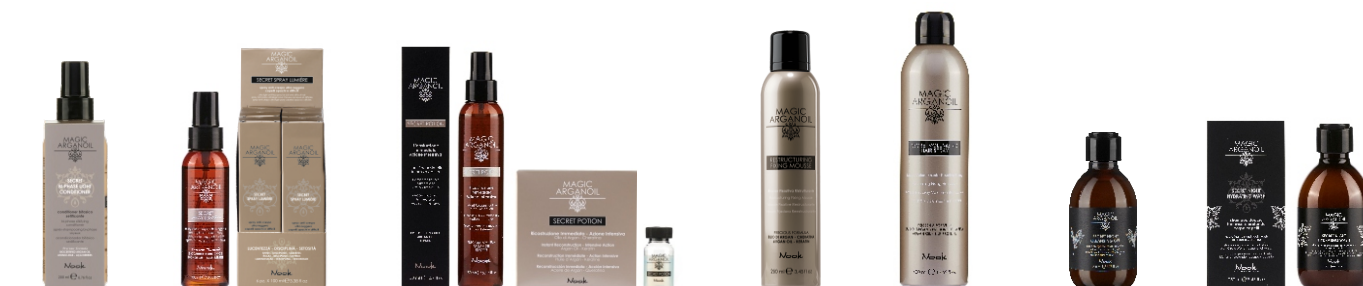
SECRET BI-PHASE LIGHT CONDITIONER 200 ml - cod. 1000533