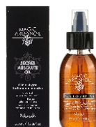
SECRET ABSOLUTE OIL 100 ml - cod. 1027587 display 6 pcs.