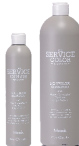
NO-YELLOW SHAMPOO 300 ml - cod. 1027615 1000 ml - cod. 1027616