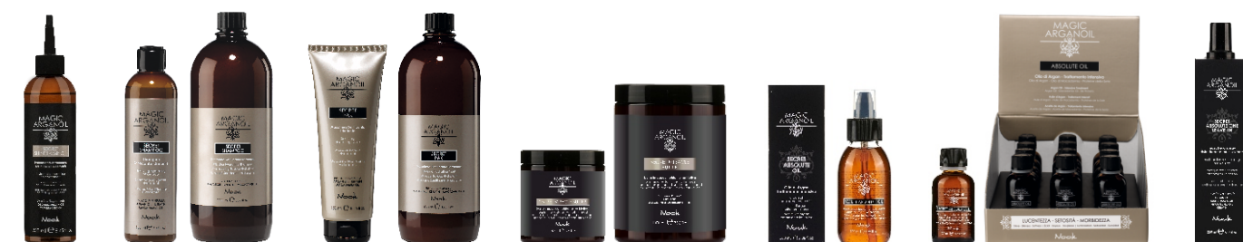
SECRET SHINE LAMINOIL 250 ml cod. 1027889