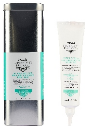
REMEDY SUPER ACTIVE PRE-TREATMENT PEELING 150 ml - cod. 1000613