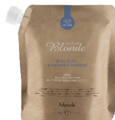
BLUE PLEX BLEACHING POWDER 500 gr. - cod. 1027878