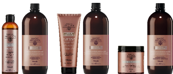
DISCIPLINE SHAMPOO 250 ml - cod. 1027002 1000 ml - cod. 1027001