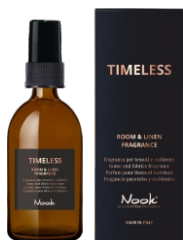
TIMELESS ROOM & LINEN FRAGRANCE FRAGRANZA PER TESSUTI E AMBIENTI 50 ml - cod. 1027874

EN Timeless is a precious and delicate fragrance for rooms and fabrics with a romantic and timeless character, which infuses a soft, clean and enveloping essence.