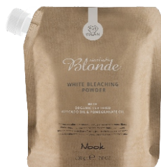
WHITE BLEACHING POWDER 500 gr. - cod. 1027879

EN Starlight Blonde is a complete and essential range of products, designed to give free rein to the creativity of every colourist, developed to deliver all the necessary tools to achieve an excellent and impeccable technical service, and maximum customer satisfaction.