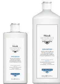
RE-BALANCE SEBO BALANCING SHAMPOO 500 ml - cod. 1027598 1000 ml - cod. 1000607