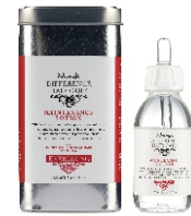
ENERGIZING MAINTENANCE LOTION 125 ml - cod. 1000616 12 pcs. x 7 ml - cod. 1000615