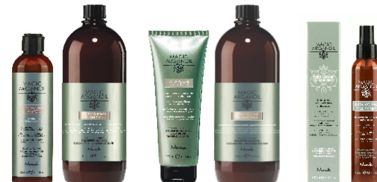
EXTRA VOLUME SHAMPOO 250 ml - cod. 1027012 1000 ml - cod. 1027011