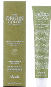
THE ORIGIN COLOR PERMANENT COLOURING CREAM 100 ml x 96 nuances