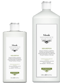
PURIFYING PURIFYING SHAMPOO 500 ml - cod. 1027597 1000 ml - cod. 1000606