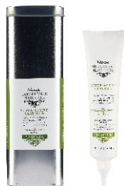
PURIFYING SUPER ACTIVE CLAY MUD 150 ml - cod. 1000614