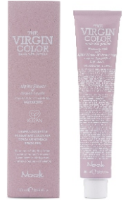
THE VIRGIN COLOR PERMANENT COLOURING CREAM 100 ml x 87 nuances