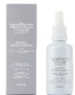
LENITIVE AROMA SYNERGY 50 ml cod. 1002132