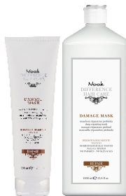
REPAIR DAMAGE MASK 300 ml - cod. 1000611 1000 ml - cod. 1000612