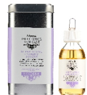
LENIDERM SUPER ACTIVE CALMING LOTION 125 ml - cod. 1000618