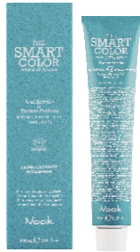
THE SMART COLOR 10 MIN. PERMANENT COLOURING CREAM 100 ml x 25 nuances