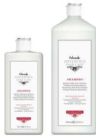
ENERGIZING STIMULATING SHAMPOO 500 ml - cod. 1000600 1000 ml - cod. 1027601