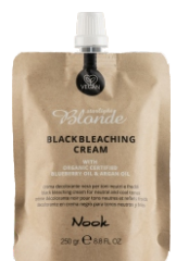
BLACK BLEACHING CREAM 250 gr. - cod. 1027801