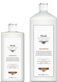
REPAIR RESTRUCTURING SHAMPOO 500 ml - cod. 1027599 1000 ml - cod. 1000619