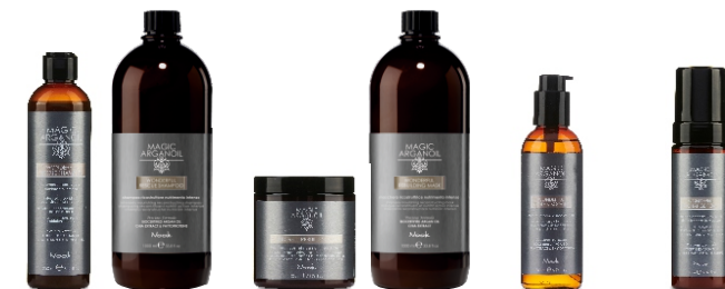
WONDERFUL RESCUE SHAMPOO 250 ml - cod. 1027196 1000 ml - cod. 1027194