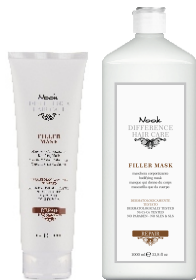
REPAIR FILLER MASK 300 ml - cod. 1000609 1000 ml - cod. 1000610