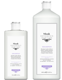
LENIDERM DELICATE SOOTHING SHAMPOO 500 ml - cod. 1027600 1000 ml - cod. 1000608