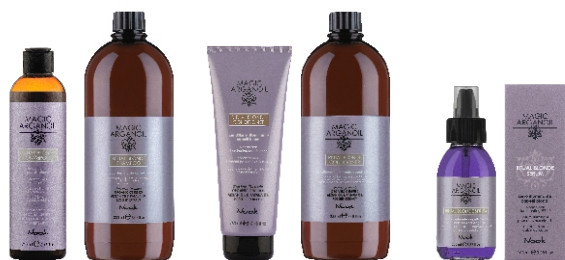
RITUAL BLONDE SHAMPOO 250 ml - cod. 1027438 1000 ml - cod. 1027439