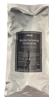
cod. RA0122C Busta 1 Benda

Disposable bandage soaked in soft gel with Dead Sea Salts, enriched with hyaluronic acid that in synergy with the plant extracts of Indian Pennywort, Horsetail and Ruscus, improve muscle tone, promoting good hydration and a strong toning action; particularly suitable for treatments aimed at counteracting epidermal imperfections from atony and relaxation of tissues. Ideal product also for breast treatment (exclude nipples).