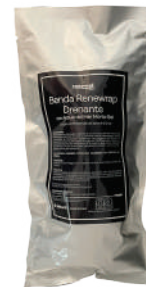
cod. RA0120C Busta 1 Benda

Renewrap disposable bandage, soaked in pure Dead Sea Water Gel, with strong draining and anti-inflammatory properties that makes the bandage suitable to counteract epidermal imperfections in subjects with Fat or Cellulite. In addition, the Renewrap Bandage combined with the Technologies of: Presso-massage, Thermo-sauna and Thermal feeding, it can be used hot or cold with Essential Oils or Mud enhancing the result.