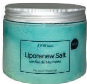
| cod. RA01170 - 500ml (PROF.)

annoying hollows with an orange peel effect, gives a drained, smooth and compact tissue, a soft and hydrated skin, through a truly unparalleled result in absolute Wellness and Relaxation. Returns a firm and dry line, obtaining a significant slimming.