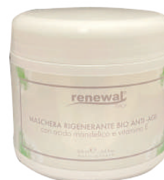
cod. RB0522V (PROF.) Vaso - 500ml

A regenerating and exfoliating mask with Mandelic acid. It is ideal for senescent and acne-prone skin. It restores brightness to the skin by performing strong anti-septic, depigmenting, and regenerating actions.