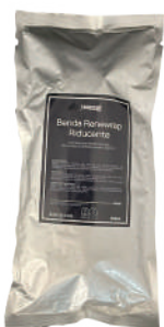
cod. RA0222C Busta 1 Benda