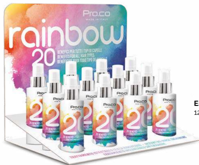
Espositore da banco 12 pz